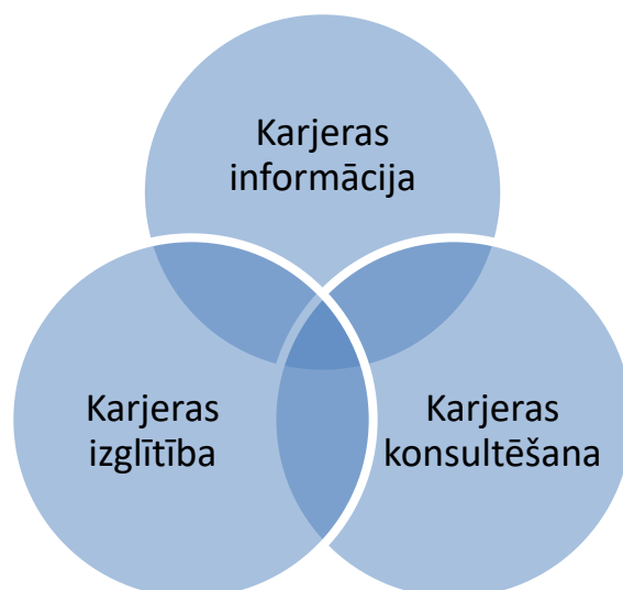
2.att. Karjeras attīstības atbalsta sistēmas komponenti (Karjeras attīstības atbalsta..., 2019)

Informācija karjeras atbalstam , tā ir nepieciešamā informācija, lai plānotu, uzsāktu profesionālo darbību un noturētos darba tirgū. Tā iekļauj informāciju par profesijām, prasmēm, karjeras ceļiem, izglītības iespējām, darba tirgus attīstības tendencēm un nosacījumiem, izglītības iestādēm, valsts un nevalstisko organizāciju sniegtajiem pakalpojumiem un darba iespējām. Šis ir pamats karjeras attīstības atbalsta sistēmai.