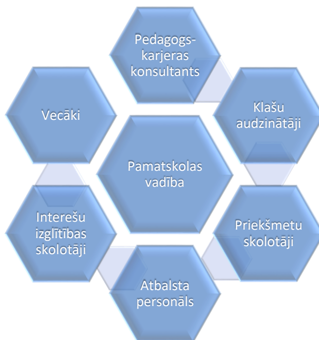
3.att. Karjeras attīstības atbalsta sistēmas īstenotāji Mārupes pamatskolā

Karjeras attīstības atbalsta sistēma Mārupes pamatskolā ir nozīmīga, jo tā palīdz skolēniem plānot un veidot savu nākotni (skatīt 3.attēlu). Šajā atbalsta sistēmā būtiska loma ir karjeras konsultantam, taču veiksmīgs rezultāts tiek sasniegts, sadarbojoties komandā ar skolas vadību, klases audzinātājiem, priekšmetu skolotājiem, interešu izglītības pedagogiem, bibliotekāriem, atbalsta personālu un skolēnu vecākiem.